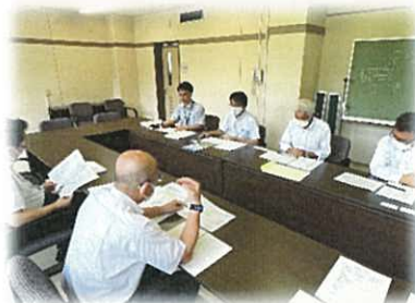
伊豆市農業委員会