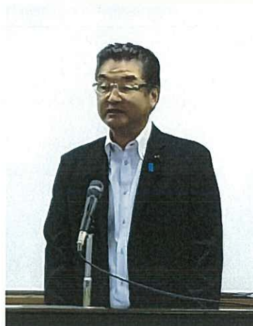
市川産業委員会委員長