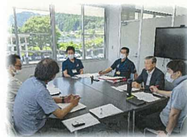
川根本町農業委員会