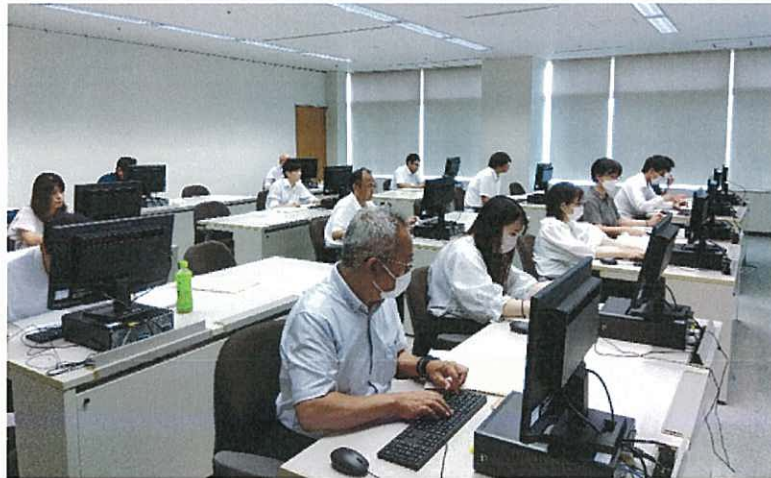
農業委員会サポートシステム操作研修会（初級）の様子