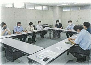
富士宮市農業委員会