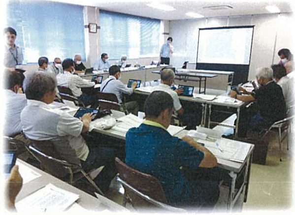
左：御殿場市の様子 右：伊豆市の様子