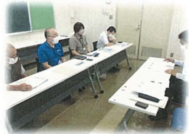
東伊豆町農業委員会