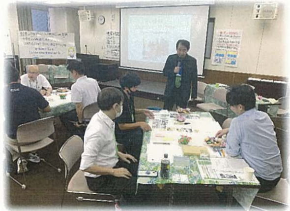
第1回地域計画策定のためのスキルマスター研修