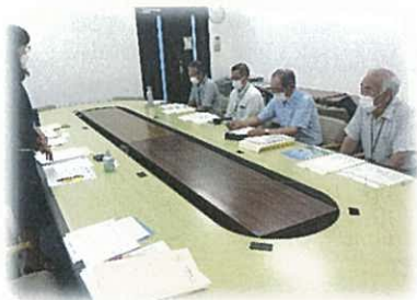
島田市農業委員会

6/12 御殿場市 6/28 島田市 焼津市 7/7 下田市 東伊豆町 7/10 伊豆市 7/11 川根本町 御前崎市 7/13 富士市 富士宮市