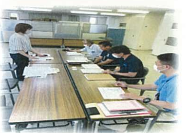
下田市農業委員会