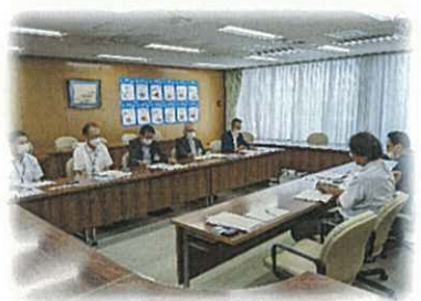
富士市農業委員会