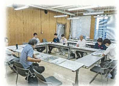
御前崎市農業委員会