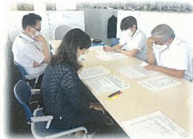
焼津市農業委員会